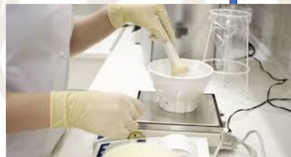
Preparazione del galenico secondo NBP con scheda preparazione e copia ricetta