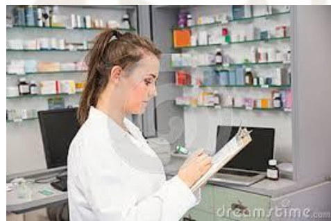
Controllo ricetta al ricevimento