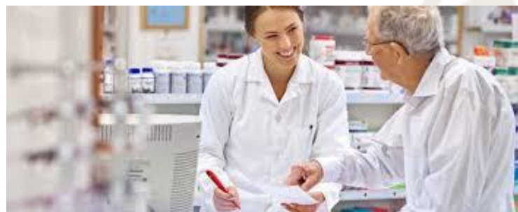
Consegna del galenico con copia ricetta timbrata e firmata dal farmacista e foglietto illustrativo completo .